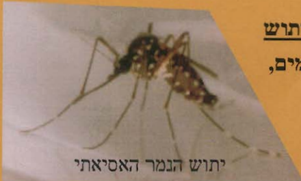
יתוש הנמר האסיאתי

יתוש הנמר האסיאתי עלול להיות מופץ ממשתלות לרחבי הארץ